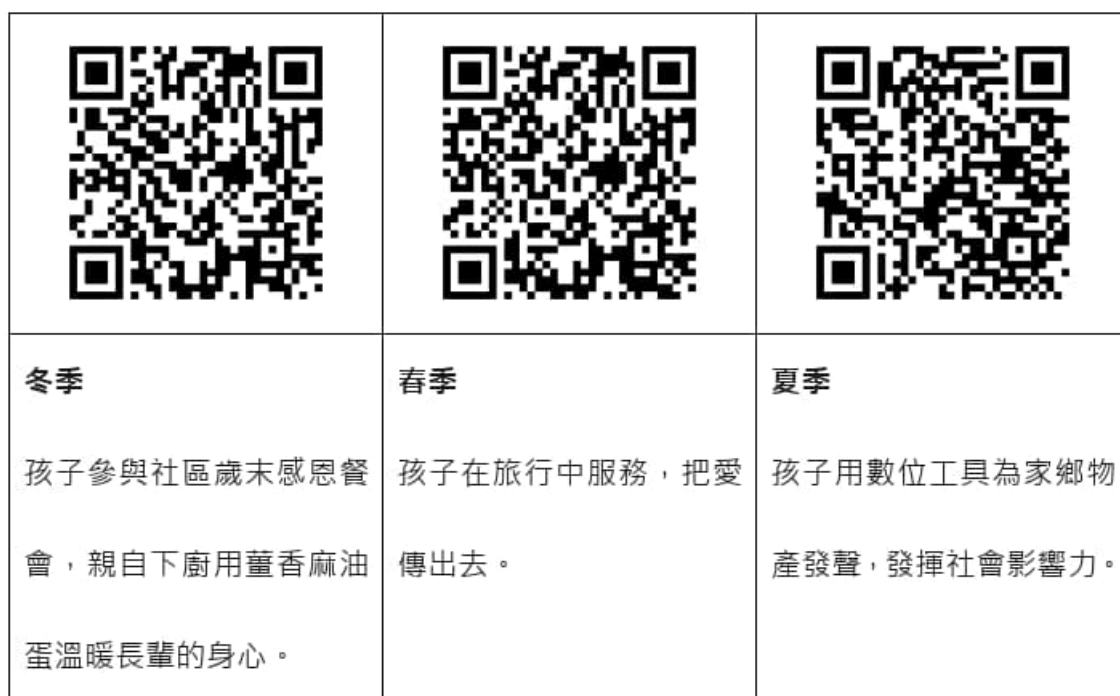
華南實驗國小推動戶外教育課程